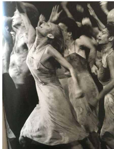
Le sacre du printemps de Pina Bausch