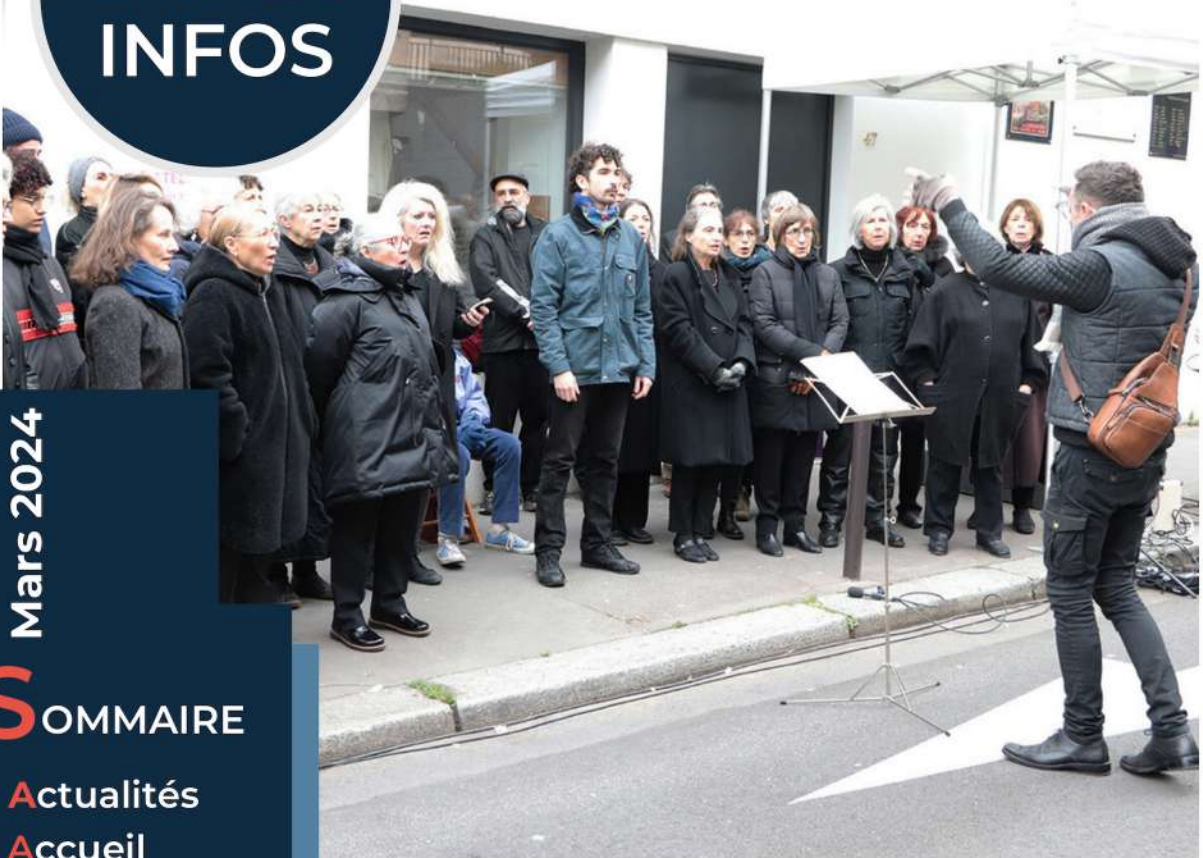
Cérémonie d'hommage au groupe Manouchian